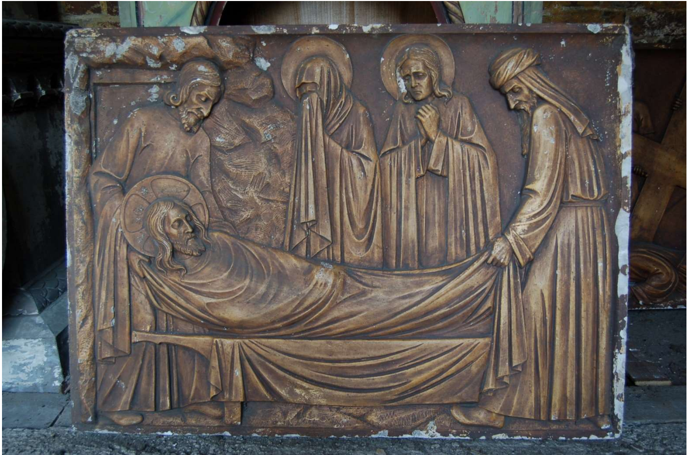
Jezus wordt in het graf gelegd (Cuypershuis Roermond statie)